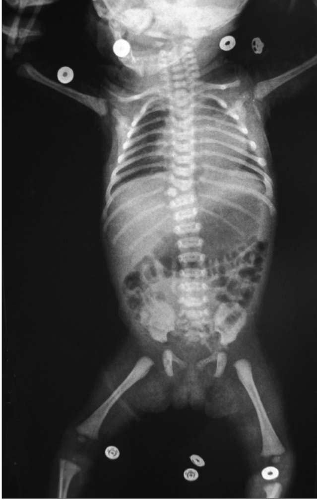
Resim 5. Torakal vertebralarda yukarıda açıklığı sola, aşağıda açıklığı sağa bakan skolyoz mevcut