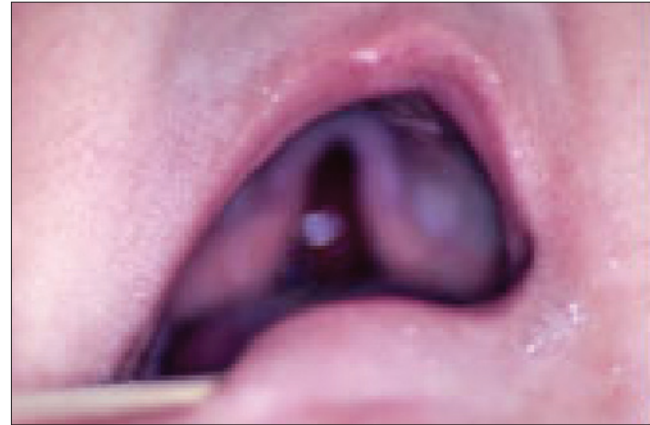
Resim 3. Yarık damak

ması için gönderilmişti. Trombositopeniye yol açabilecek ilaç kullanım öyküsü yoktu. Fizik muayenede enfeksiyon lehine bir bulgu yoktu. Palpasyonla karaciğer ve dalak büyüklüğü tespit edilmedi. Trombositopeniye yol açabilecek hemanjiom tespit edilemedi. Tam kan sayımı ve periferik yaymada hemoliz olmadığı görüldü ve malign hastalıklar lehine bulgu tespit edilemedi. Yenidoğan ünitemize yatışının 3. gününde trombositopeninin kendiliğinden düzelmesi nedeniyle daha ileri incelemelerin yapılmasına gerek duyulmadı. Yenidoğan bakım şartlarının ileriye gitmesi, solunum sistemi enfeksiyonlarının etkili tedavisi ve tekrarlamasının önlenmesi sayesinde Jarcho Levin sendromlu olguların yaşam süreleri uzamaya başlamıştır. Böylece bu sendromlu olguların sayısı artış göstermektedir. Jarcho Levin sendromundan şüphelenilen olguların eşlik edebilecek değişik sistemlere ait anomaliler için ayrıntılı incelenmeleri gereklidir.