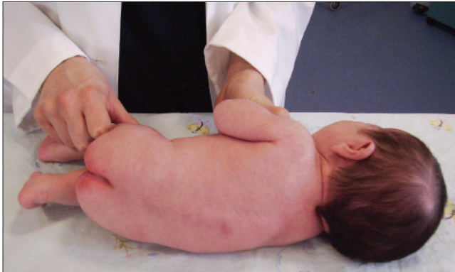
Resim 2. Dorsal skolyoz

ması için gönderilmişti. Trombositopeniye yol açabilecek ilaç kullanım öyküsü yoktu. Fizik muayenede enfeksiyon lehine bir bulgu yoktu. Palpasyonla karaciğer ve dalak büyüklüğü tespit edilmedi. Trombositopeniye yol açabilecek hemanjiom tespit edilemedi. Tam kan sayımı ve periferik yaymada hemoliz olmadığı görüldü ve malign hastalıklar lehine bulgu tespit edilemedi. Yenidoğan ünitemize yatışının 3. gününde trombositopeninin kendiliğinden düzelmesi nedeniyle daha ileri incelemelerin yapılmasına gerek duyulmadı. Yenidoğan bakım şartlarının ileriye gitmesi, solunum sistemi enfeksiyonlarının etkili tedavisi ve tekrarlamasının önlenmesi sayesinde Jarcho Levin sendromlu olguların yaşam süreleri uzamaya başlamıştır. Böylece bu sendromlu olguların sayısı artış göstermektedir. Jarcho Levin sendromundan şüphelenilen olguların eşlik edebilecek değişik sistemlere ait anomaliler için ayrıntılı incelenmeleri gereklidir.