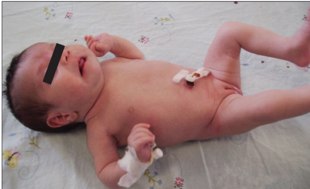
Resim 1. Kısa boyun ve kısa gövde

Sunduğumuz olgu yenidoğan döneminde Jarcho Levin sendromu tanısı almıştır. Olgumuzda daha önce Jarcho Levin sendromlu olgularda tanımlanmış olan torakal skolyoz, hemivertebrada, vertebral posterior füzyon defekti ve geniş kostalar mevcuttu. Şimdiye kadar Jarcho Levin sendromu tanısı almış olan olgularda yarık damak tanımlanmamış olması nedeniyle bu birlikteliğin olduğunu bildirmek için olgumuzu sunduk. Hasta bize yaşamın 3. gününde trombositopenisinin araştırıl-